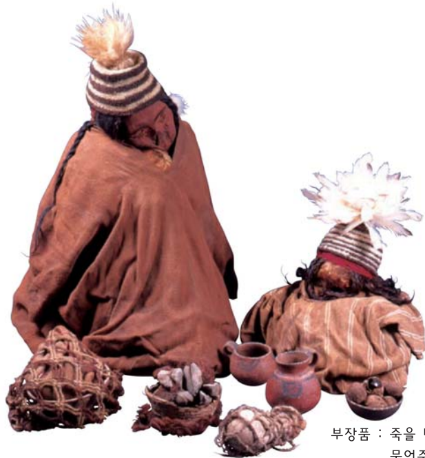
부장품 : 죽을 때 사용하던 물건을 무덤에 함께 묻어주는 물건. '꺼묻거리'라고도 합니다.