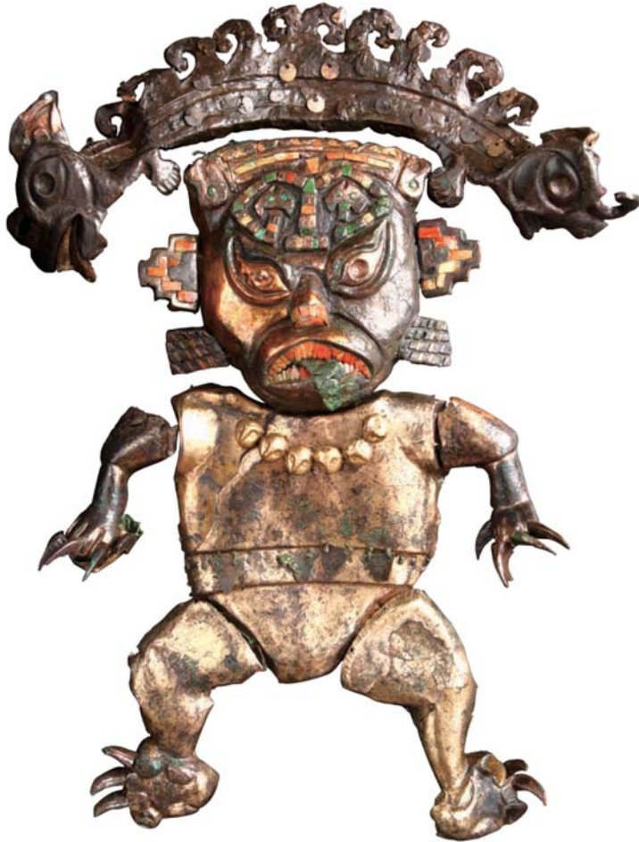
[ 배 포 용 ]